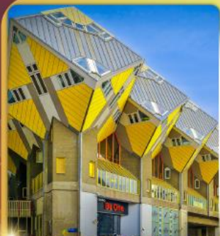
บ้านลูกเต่า โคกคูนุส

“ล่องเรือหลังคากระจก” ชมกรุงอัมสเตอร์ดัม