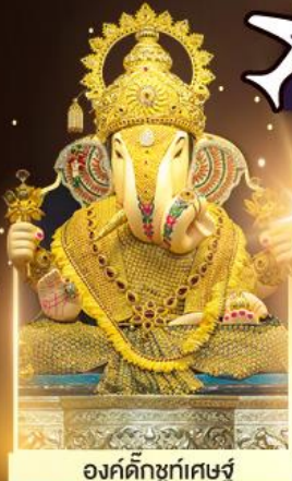
องค์ดีกษุท์เศษฐ์