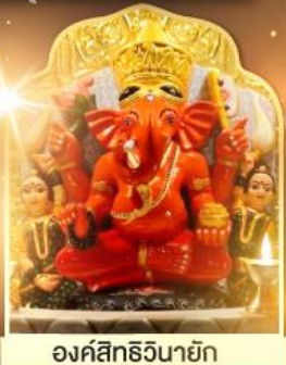
องค์สิทธีวินายก