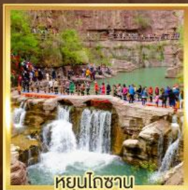
หยุ่นโกซาน