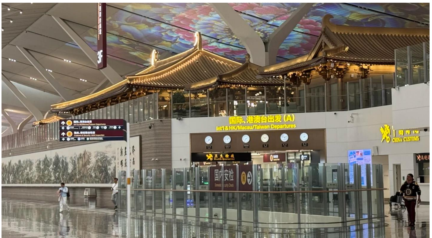
GO1XIY-SL006 บินตรงซีอาน ย้อนเวลาสู่อางอัน เจิ้งโจว ลั่วหยาง หยุนไถซาน 6 วัน 5 คืน โดยสายการบิน ไทย ไลออนแอร์ (SL)