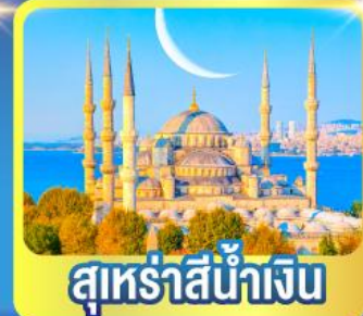
สุเหร่าสีน้ำเงิน