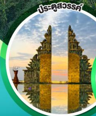
ประศุสวรรค์