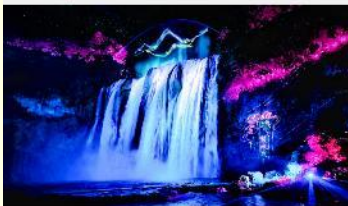
อุทยานน้ำตกหวงกั๋วซู่