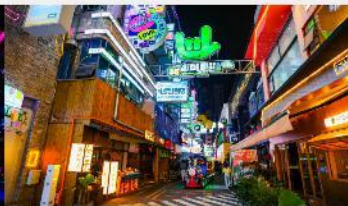
ถนนคนเดินซิงหยุน