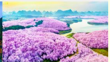
ชากรุง-ผิงป่า

*ทางบริษัทฯ ขอสงวนสิทธิ์ในการสลับโปรแกรมทัวร์ตามความเหมาะสมขึ้นอยู่กับสถานการณ์หน้างาน โดยคำนึงถึงผลประโยชน์ของลูกค้าเป็นสำคัญ