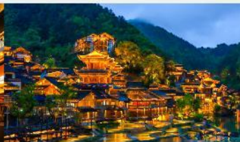
หมู่บ้านโบราณวูเจียงจ้าย