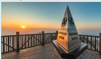
ฟานซิปิน