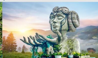
โมอาน่าคาเฟ่

*ทางบริษัทฯ ขอสงวนสิทธิ์ในการสลับโปรแกรมทัวร์ตามความเหมาะสมขึ้นอยู่กับสถานการณ์หน้างาน โดยคำนึงถึงผลประโยชน์ของลูกค้าเป็นสำคัญ