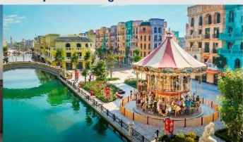
Mega Grand World