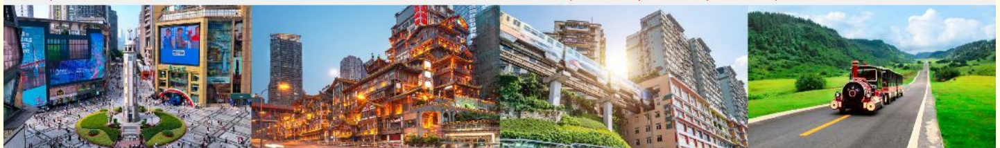
ถนนเจี๋ยฟางเป่ย์