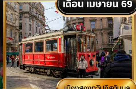
เมืองสองทวีปอิสตันบูล