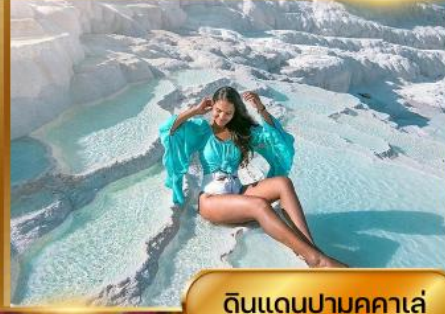
ดินแดนปามุคคาเล่