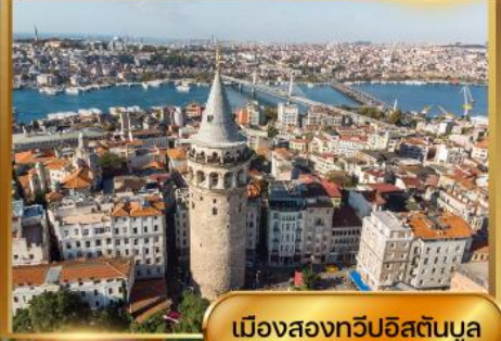
เมืองสองทวีปอิสตันบูล