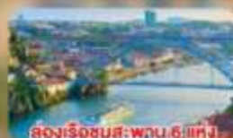
ล่องเรือชมสะพาน 6 แห่ง ในคูร์เมืองปอร์โต