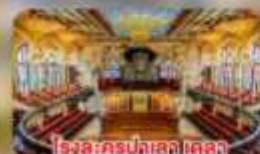
โรงละครปลาส เดลลา มูสิคกา คาตาลา