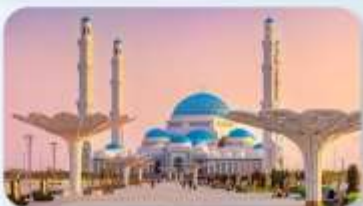
Astana Grand Mosque