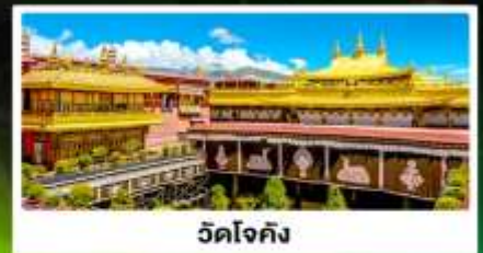
วัดโจกัง