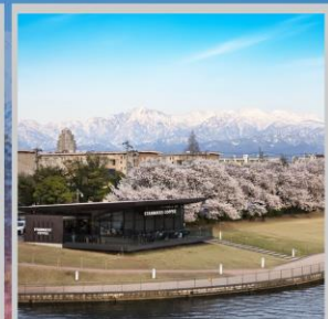
“TOYAMA KANSUI PARK”