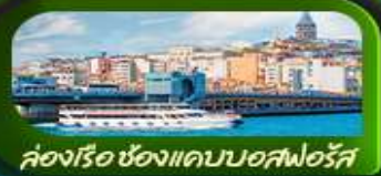
ช่องเรือ ซองแควบอสฟอรัส