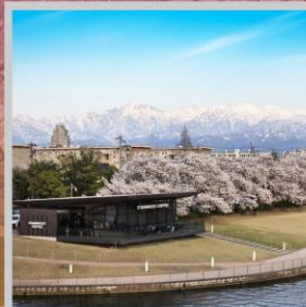
"TOYAMA KANSUI PARK"