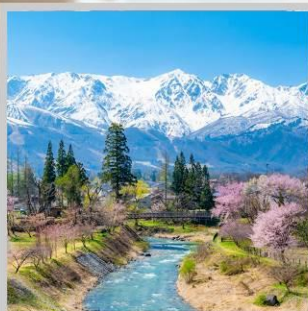
“HAKUBA OIDE PARK”