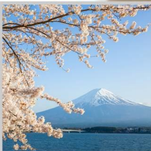
“LAKE KAWAGUCHIKO SAKURA”