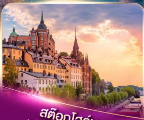
สต็อกโฮล์ม เวนิสแห่งยุโรปเหนือ