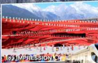
โชว์ IMPRESSION O