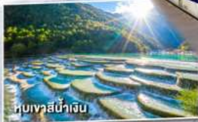
หุบเขาสีน้ำเงิน