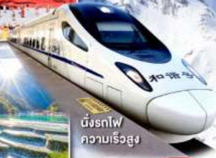
มังกรไฟ ความเร็วสูง